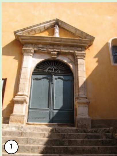
L'Église Saint-Martin de Châteauneuf X e siècle

Balade découverte des chapelles, églises et lavoirs