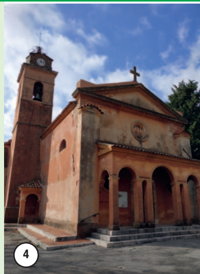
L'Église Saint-Laurent- de-Magagnosc XVII e siècle

Itinéraire : Au départ du parking place Clémentceau, face à la Mairie, prendre la rue de l'Église ❶. Place de la Vieille Mairie prendre à droite puis descendre à gauche la rue du Four . Continuer sur la droite pour prendre chemin du Moulin et continuer tout droit chemin de l'Aire de la Couale .