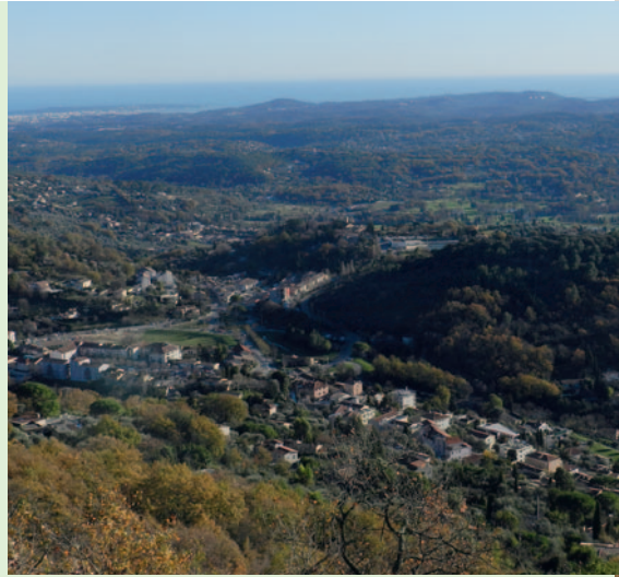
Vue depuis l'oratoire

Il comporte de nombreux ouvrages d'art au-dessus du vide et 22 tunnels d'une longueur totale de 2600 m. C'est un ouvrage classique du style aqueduc qui sera remplacé dans les années cinquante par le gros tuyau actuellement en place.