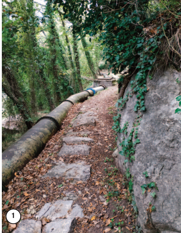
Le canal du Foulon : Il dessert en eau potable les villes de Châteauneuf, Gourdon, Opio et le Bar-sur-Loup.

Vous empruntez des petites routes communales à faible circulation, mais restez prudent !