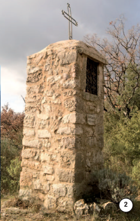
Oratoire dédié à saint André. En provençal, « pieloun » signifie « Colonne de pierre comportant une niche qui abrite l'image d'un saint ».