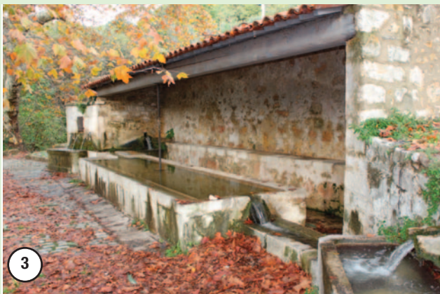
Lavoir de la Grande Fontaine, on peut y observer deux abreuvoirs et une auge pour laver le blé et la laine.

Traversez de jolis petits endroits bucoliques avec de magnifiques vues sur le village et découvrez la source de la Brague, alimentée naturellement par les sources karstiques souterraines de Gourdon et de Grasse.