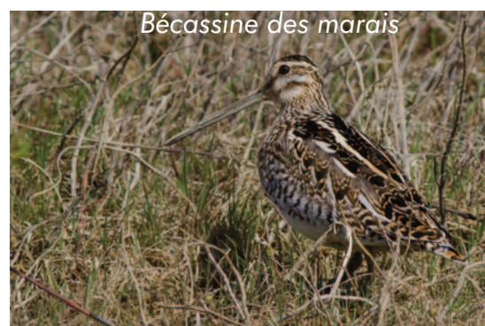
Bécassine des marais