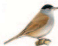
Fauvette à tête noire