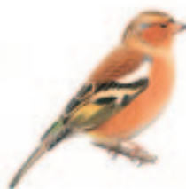
Pinson des arbres